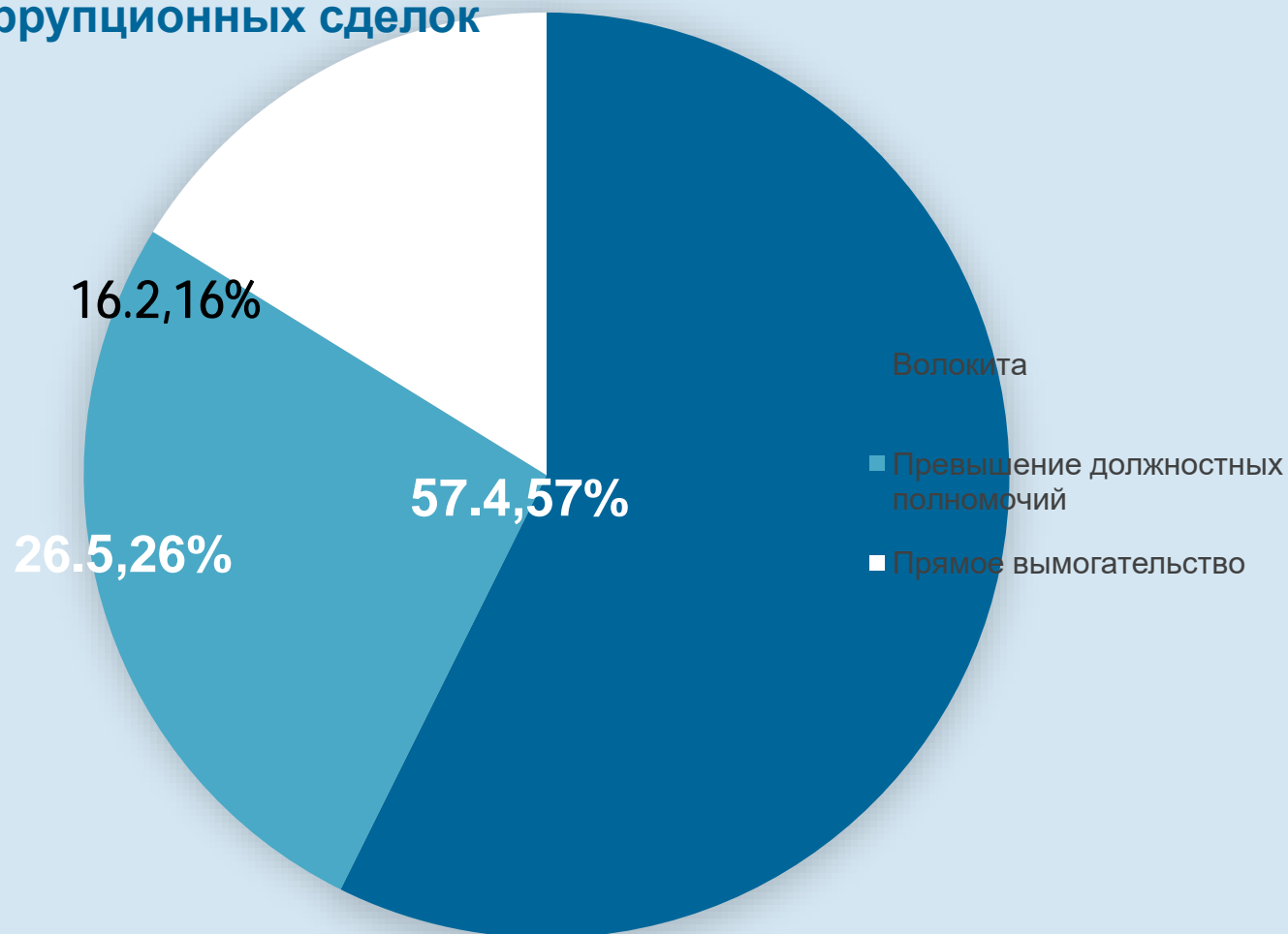
Причина коррупционных сделок